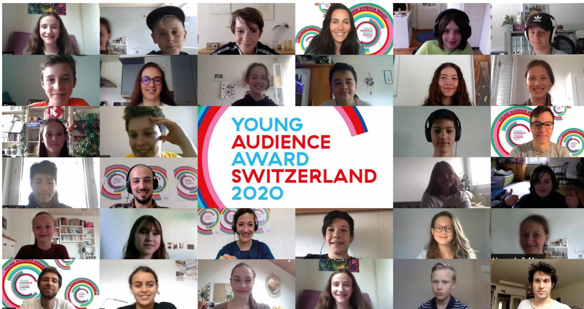
Photomontage rassemblant tous les participant-e-s suisses (Lucerne + Lausanne) de l'édition 2020 du YAA