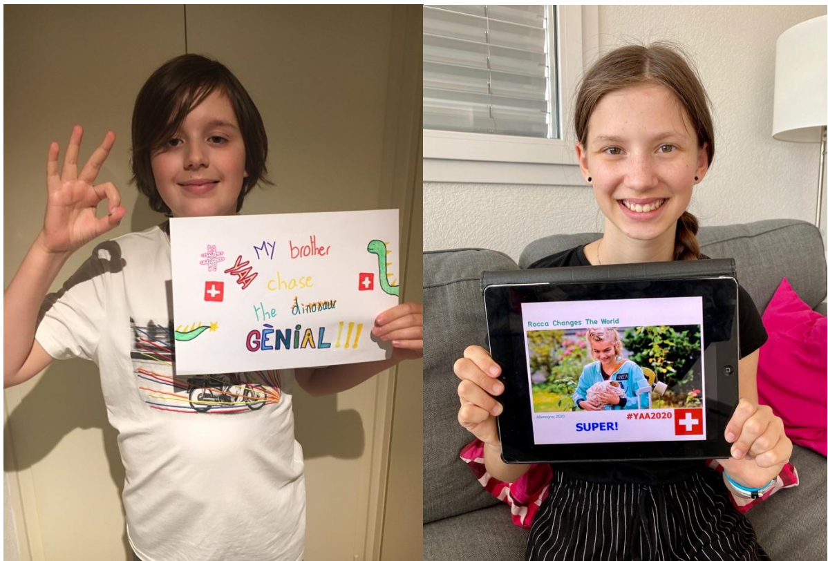
Photos de participant-e-s après le visionnement des films